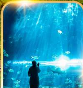
อควาเรียม