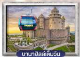
บาน่าฮิลล์เต็มวัน