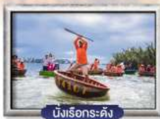
นั่งเรือกระดิง