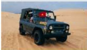
ทะเลทรายขาว