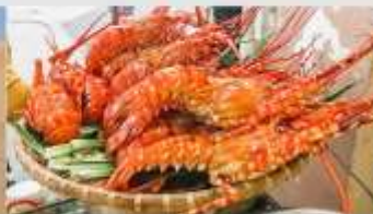
Nha Trang Night Market