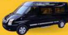
VAN (7-8 ท่าน)