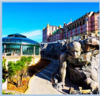
โซอู Eclipse Square