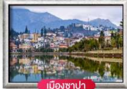
เมืองซาปา