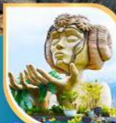
โมนาน่า ซาปา คาเฟ่