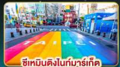
ซีเหมินติงไนท์มาร์เก็ต