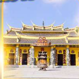
วัดชอพรเทพเจ้า