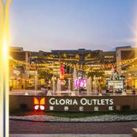
กลอเรีย เอาท์เล็ต