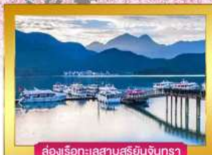
ล่องเรือทะเลสาบสุริยันจันทรา