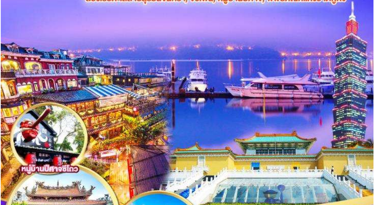
หมู่บ้านปีศาจชไต

ล่องเรือทะเลสาบสุริยอันจนทรา, จิวเฟิ่น, หมู่บ้านปีศาจ, พิพิธภัณฑที่แห่งชาติกู่กง