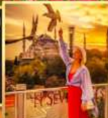
ลู่ฟกือปเซเวนฮิลล์ส