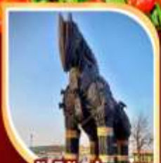
ม้าไม้แห่งทรอย