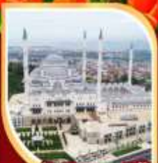
มัสยิดคามลิก้า