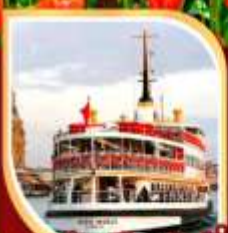
ล่องเรือเฟอร์รี่