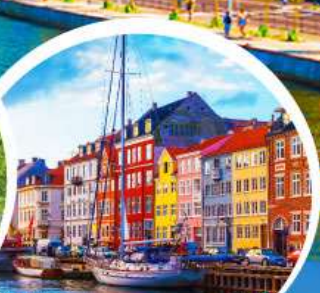
ท่าเรืออูวอน.โคเปนเฮเกน