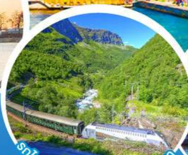
รถไฟสายโรแมนติกฟลินส์บานา