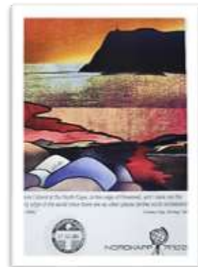
North cape Certificate