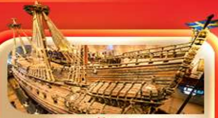
พิพิธภัณฑ์ท้าวชา