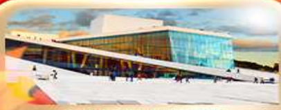
OSLO OPERA HOUSE