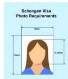
ตัวอย่างรูปถ่าย