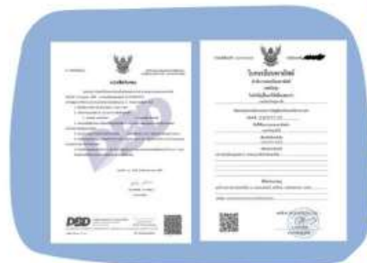
ตัวอย่างหนังสือจดทะเบียนบริษัทฯ และ ใบทะเบียนพาณิชย์