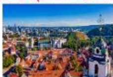
Vilnius Old Town