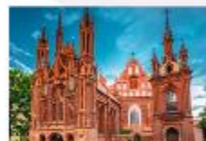
โบสถ์เซนต์แอน