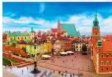
จัตุรัสเมืองเก่า