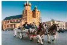
Krakow Old Town

05.15 น. เดินทางถึงสนามบินอิสตันบูล แวะเปลี่ยนเครื่อง 07.25 น. ออกเดินทางสู่สนามบินคราคูฟ เที่ยวบิน TK1271 08.45 น. เดินทางถึงสนามบินคราคูฟ ประเทศโปแลนด์