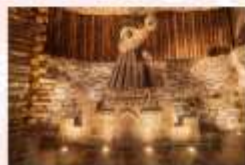
เหมืองเกลือวิลิชก้า