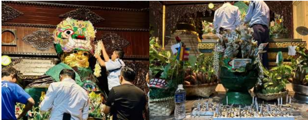
วิธีการขอพรจากแม่ยักษ์

พาท่านเดินไปขอพรที่ แม่ยักษ์ ผู้ปกป้องดูแลเจดีย์ คนพม่าเชื่อว่าแม่ยักษ์...จะช่วยให้การตัดกรรมจากเจ้ากรรมนายเวร โดยเฉพาะอย่างยิ่งผู้ที่มีเวรกรรมกับเจ้ากรรมนายเวรทั้งหลายช่วยขจัดเคราะห์กรรม ขจัดอุปสรรค ติดขัดต่างๆ ความมาอธิษฐานขอให้ท่านช่วย ให้ชีวิตของคุณมีแต่ดีขึ้นเรื่อยๆ ซึ่งถ้าหากคุณกำลังมีทุกข์และหาหนทางไม่ออก ก็ลองมาไหว้ขอพรจะแม่ยักษ์ให้ช่วยบันดาลให้สิ่งร้ายๆ สิ่งไม่ดี ออกไปจากชีวิต และขอให้ชีวิตมีแต่สิ่งดีๆเข้ามา นอกจากนี้ยังเชื่อกันว่าแม่ยักษ์...ยังช่วยเรื่องความมีชื่อเสียงโด่งดัง เป็นที่รู้จักก้าวหน้าในหน้าที่การงาน ใครที่ตกงานอยู่ จุดนี้เป็นอีกหนึ่งจุดที่ต้องห้ามพลาด ปล.แม่ยักษ์จะประดิษฐานอยู่ติดกับบันไดประตูทางทิศตะวันออกค่ะ