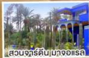
สวนจาร์ดิน|มาจออเรล