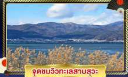
จุดชมวิวกะเลสาบสุมะ