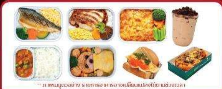
** ภาพเมนูตัวอย่าง รายการอาหารอาจเปลี่ยนแปลงได้ตามช่วงเวลา