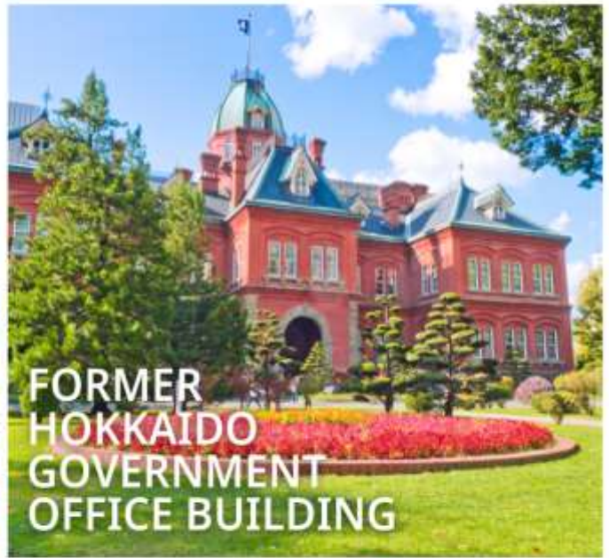
FORMER HOKKAIDO GOVERNMENT OFFICE BUILDING

เป็นตึกสไตล์นีโอบารอค มีลักษณะพิเศษที่มีหลังคายอดแหลมและกรอบหน้าต่างเป็นเอกลักษณ์ เปรียบเสมือนอนุสาวรีย์การบุกเบิกของฮอกไกโด ปัจจุบันได้รับการขึ้นทะเบียนเป็นมรดกทางวัฒนธรรมของชาติ