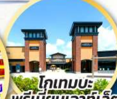
โทเทมบะ-พรีเมียมเอาท์เล็ต