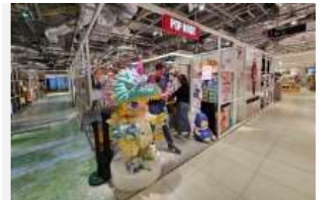
POP MART สายจุ่มถูกใจสิ่งนี้ !