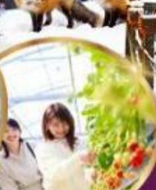
บุฟเฟต์ สดอเบอร์รี่ เก็บสดจากต้น