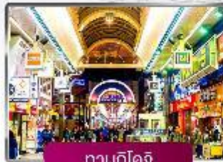
ทานุกิโดจิ