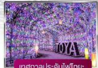
เทศกาลประดับไฟไทย