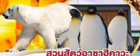
สวนสัตว์อาซาฮิคาว่า