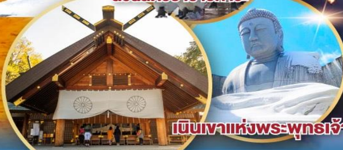
เป็นเขาแห่งพระพุทธรเจ้า