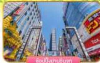
ช้อปปิ้งย่านชินจูกุ