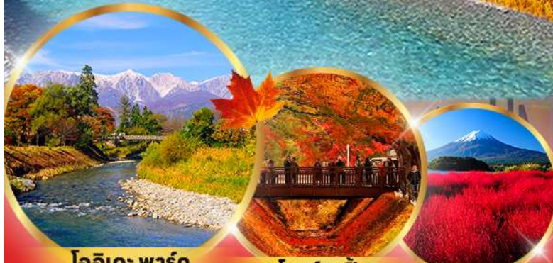
โออิดะ พาร์ค