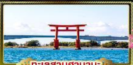
ทะเลสาบฮามานะ