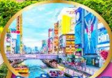
ช้อปปิ้งชินไซบาชิ