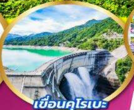
เขื่อนคุโรเบะ