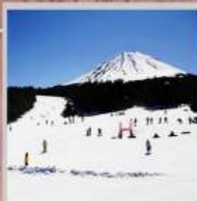
"FUJITEN SNOW PARK"