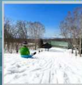
"NISEKO SKI RESORT"