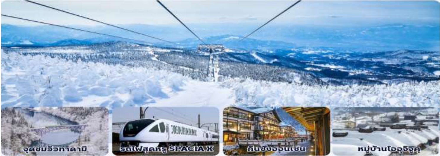
จุดชมวิวกาดามิ