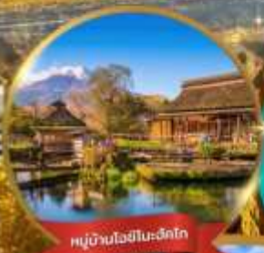
หมู่บ้านไอชิโนะฮะโกะ