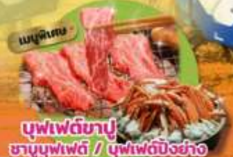
บุฟเฟ่ต์ซาปู ซาบูบุฟเฟ่ต์ / บุฟเฟ่ต์บิงชัง