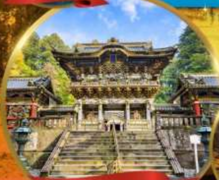
ศาลเจ้ามิกโกโทโยคุ