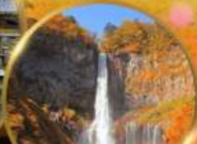
น้ำตกเคกอน