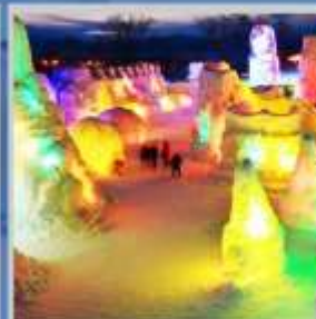
"SHIKOTSU ICE FEST"