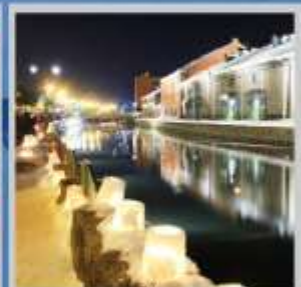
"OTARU CANAL FEST"