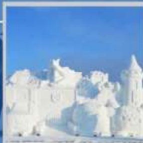
"ASAHIKAWA SNOW FEST"