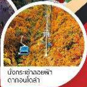
มังกร-ฮาลอลายฟ้า ตาก่อนโตเกียว

Wifi on bus บริการน้ำดื่ม 10 คน ออกเดินทาง