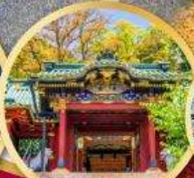
ศาลเจ้าโทโฮคุ