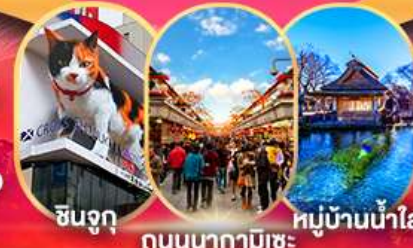
ชินจูกุ ถนนนากามิเซะ หมู่บ้านน้ำใส

วัดอาซากุสะ ถนนนากามิเซะ โตเกียว สกายทรี โอไดบะ โตเวอร์ซิตี้ ล่องเรืออุทยานฮาโกเน่ โอชิโนะฮักโก เจคีย์ซูเรโต พิพิธภัณฑ์แผ่นดินไหว