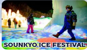
SOUNKYO ICE FESTIVAL