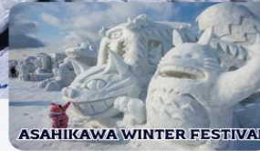
ASAHIKAWA WINTER FESTIVAL