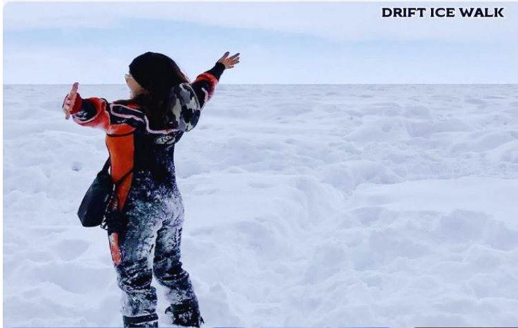
DRIFT ICE WALK

คุชิโระ-อะคัง-อะบาชิริ-ชิเรโตโกะ-โซฮุนเคียว-อาซาฮิกาวา-โอดารุ-ซัปโปโร