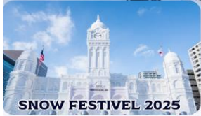
SNOW FESTIVAL 2025