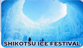
SHIKOTSU ICE FESTIVAL