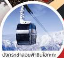
นั่งกระเช้าลอยฟ้าชินโงกะ

เที่ยวโตเกียว ๑ ๓ ๕ ๗ ๙ ๑๑ ๑๓ ๑๕ ๑๗ ๑๙ ๒๑ ๒๓ ๒๕ ๒๗ ๒๙ ๓๑ ๓๓ ๓๕ ๓๗ ๓๙ ๔๑ ๔๓ ๔๕ ๔๗ ๔๙ ๕๑ ๕๓ ๕๕ ๕๗ ๕๙ ๖๑ ๖๓ ๖๕ ๖๗ ๖๙ ๗๑ ๗๓ ๗๕ ๗๗ ๗๙ ๘๑ ๘๓ ๘๕ ๘๗ ๘๙ ๙๑ ๙๓ ๙๕ ๙๗ ๙๙