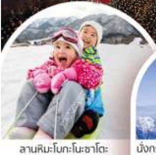
ลานสกี-โบก-โนะซาโตะ