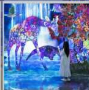
"TEAM LAB FOREST"