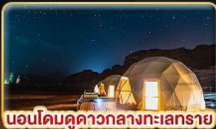
นอนโดมคูดาวกลางทะเลทราย

บินตรงสู่ “จอร์แดน” เยือน 7 มหัศจรรย์ของโลก