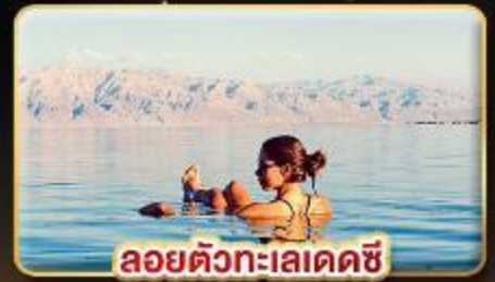
ลอยตัวทะเลเดคซี