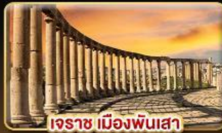
เอรราช เมืองพันเสา