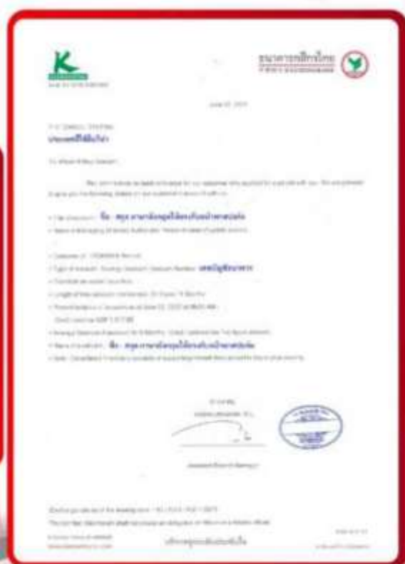
ตัวอย่าง Bank Guarantee ที่ผู้สมัครต้องยื่นกับธนาคาร