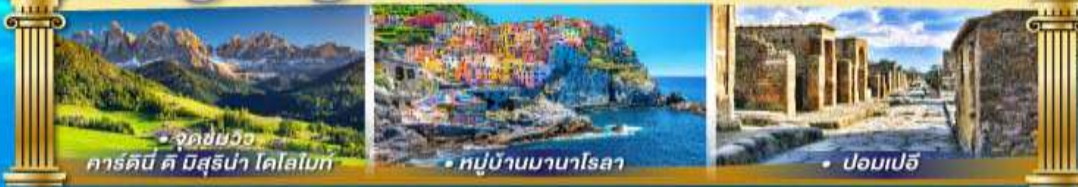
• จุดชมวิว คาร์ดินี คี บิสสุร่า โดโลไมท์