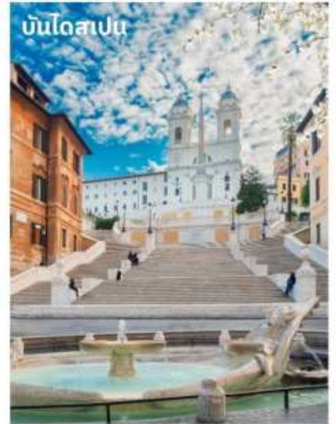
บันไดสเปน