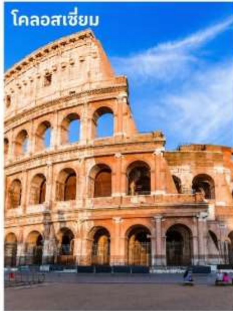
โคลอสเซียม