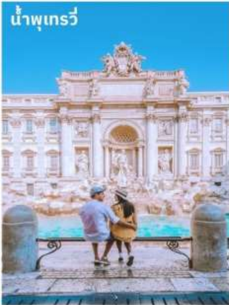
น้ำพุเทรวี

จากนั้นอิสระตามอัธยาศัยกับการเลือกซื้อสินค้าแฟชั่นและของที่ระลึกในบริเวณย่าน บันไดสเปน (The Spanish Step) ซึ่งเป็นแหล่งแฟชั่นชั้นนำสุดหรูและยังเป็นแหล่งนัดพบของชาวอิตาเลียน