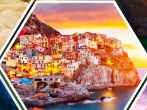
หมู่บ้านมาราโรลา