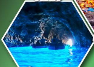
ถ้ำลูกรोटโต้