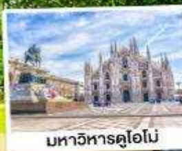
มหาวิหารคูโอโน