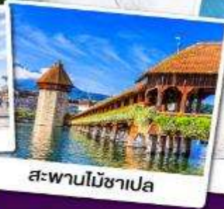
สะพานไม้อาเปลา